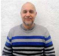
Rafael Romero Visual i Plàstica